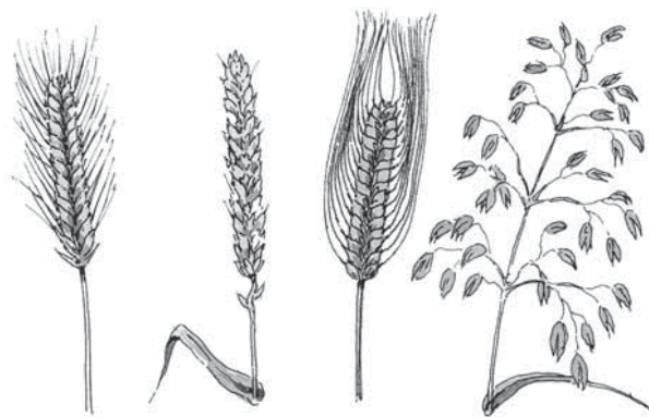
rožka pšeńca ječmjeń wows

Nimo rožki plahuje so pola nas tež pšeńca, ječmjeń a wows. Žita móžemy najlěpje na jich płódnistwach (Fruchtstände) rozeznować. Pšeńca ma tołste zornjatka bjez kochtow. Ječmjeń spóznajemy na jara dołhich kochtach. Wows ma rozlatku (Rispe) jako płódnistwo. Tamne žita maja klósku (Ähre).