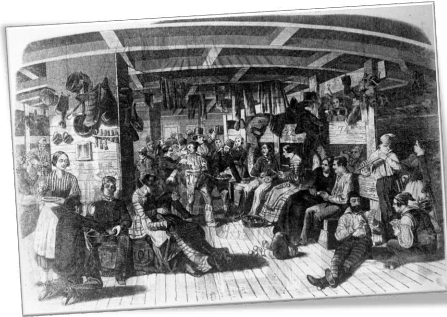
Němscy wupućowarjo po puću do USA přez Rotterdam a Le Havre na lódzi "Samuel Hop" w aprylu 1849

W 19. lětstotku je wjele němskich a serbskich ludži do Ameriki abo tež do Awstralskeje wupućowało.